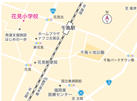
花見小学校 花見東4-2-1