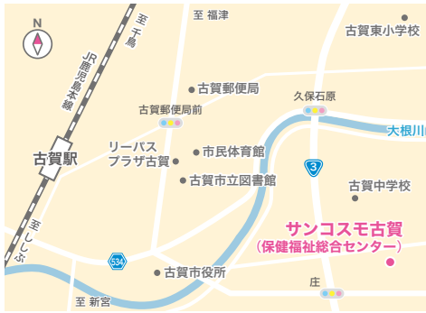
サンコスモ古賀 庄205番地